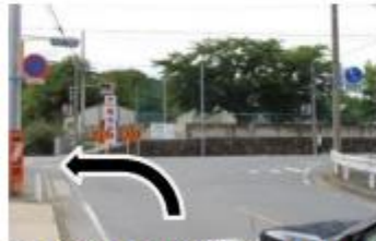
②交差点「浄法寺」左折